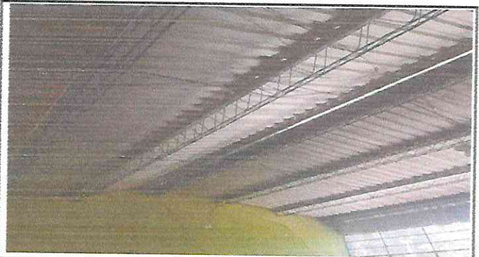
Foto 4: Finalizada la instalación de costanera y techo de lamina aluzinc calibre 26 en aula.