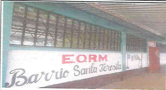
Foto 1: Finalizada la instalación de balcones en ventanas de cocina y aulas.