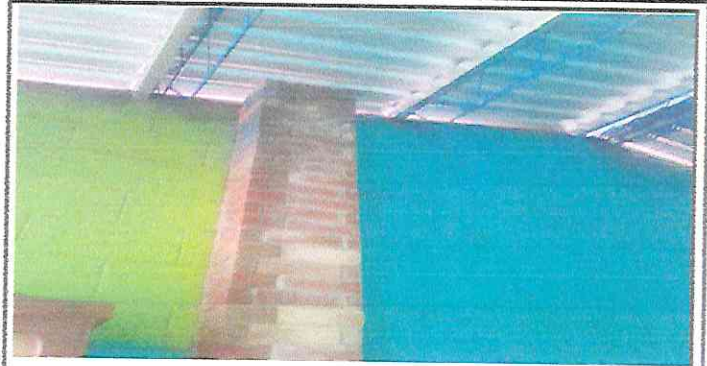
Foto 2: Finalizada la instalación de lamina aluzinc calibre 26 en cocina.