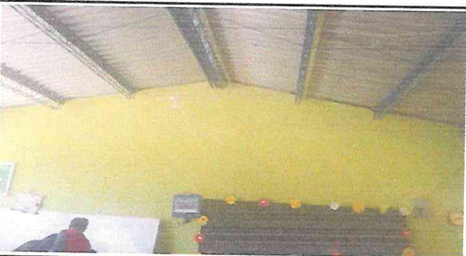
Foto 3: Finalizada la instalación del nuevo techo de lamina aluzinc calibre 26 en aulas.