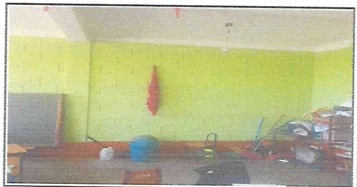
Foto 6: Finalización de pintura en muros exteriores e interiores en las aulas.

Observación: Si es necesario se pueden agregar hojas adicionales y actualizar el registro.